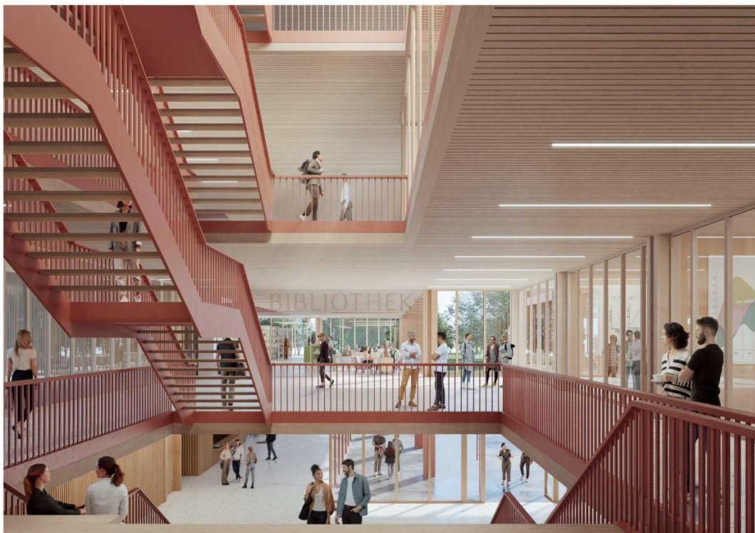
Abbildung 2 Innenraumrendering Quelle: Architekturbüro a+r Architekten mit bäuerle landschaftsarchitektur + stadtplanung