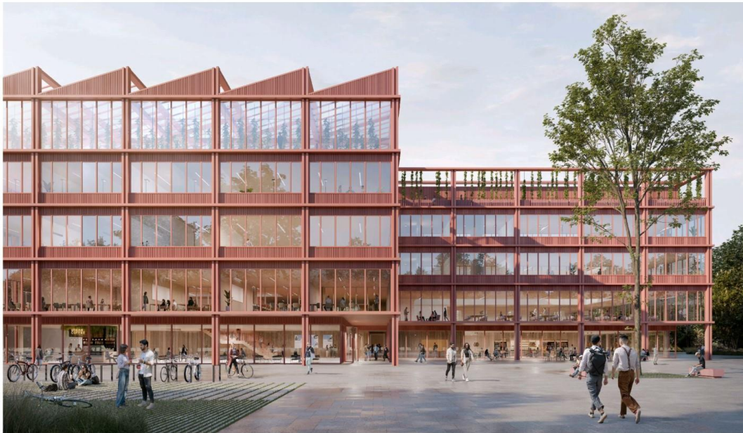
Abbildung 1 Außenraumrendering Quelle: Architekturbüro a+r Architekten mit bäuerle landschaftsarchitektur + stadtplanung